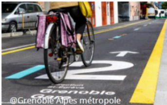
Chronovélo - Grenoble