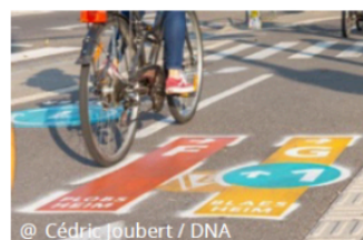
Vélostras - Strasbourg